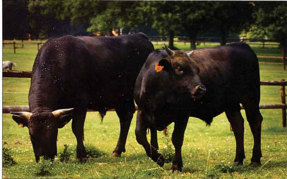
Trage groei garantie voor lekker vlees: 165 kg in tweeënhalve jaar

fokkerij met als doel energie snel beschikbaar te krijgen bij de spieren van de dieren die oorspronkelijk als trekdier fungeerden. Deze specifieke vleesstructuur is voor de naar België verhuisde Limburger ook de belangrijkste reden om het kruisen van de Wagyu's te hekelen. 'Daarmee verlies je het specifieke karak-